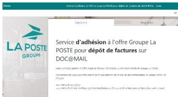
Phase 1 : Enrôlement

La Poste vous propose une solution gratuite permettant de transmettre vos factures et avoirs par e-mail au format PDF SIGNE et NON SIGNE